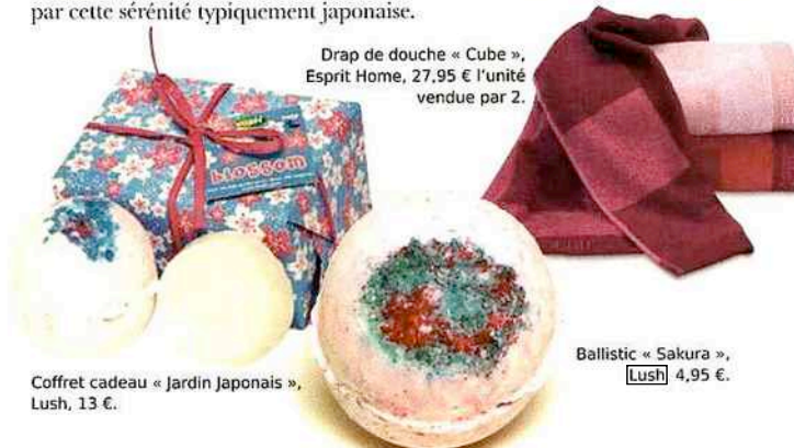
Coffret cadeau « Jardin Japonais », Lush, 13 €.