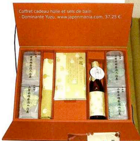
Coffret cadeau huile et sels de bain - Dominante Yuzu. www.japonmania.com, 37,25 €.